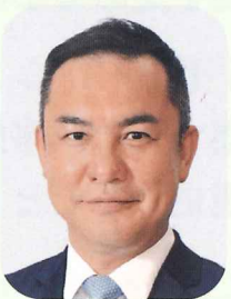
前三重県知事 鈴木 英敬