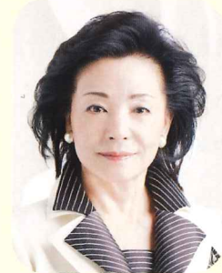
美しい日本の憲法をつくる国民の会 共同代表 櫻井よしこ