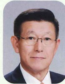
秋田県知事 佐竹 敬久