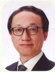
日本経済団体連合会 専務理事 井上 隆